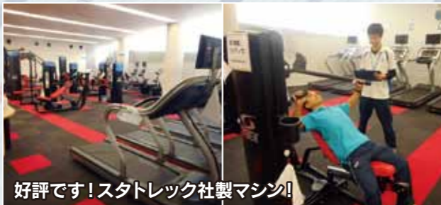
好評です!スタトレック社製マシン!